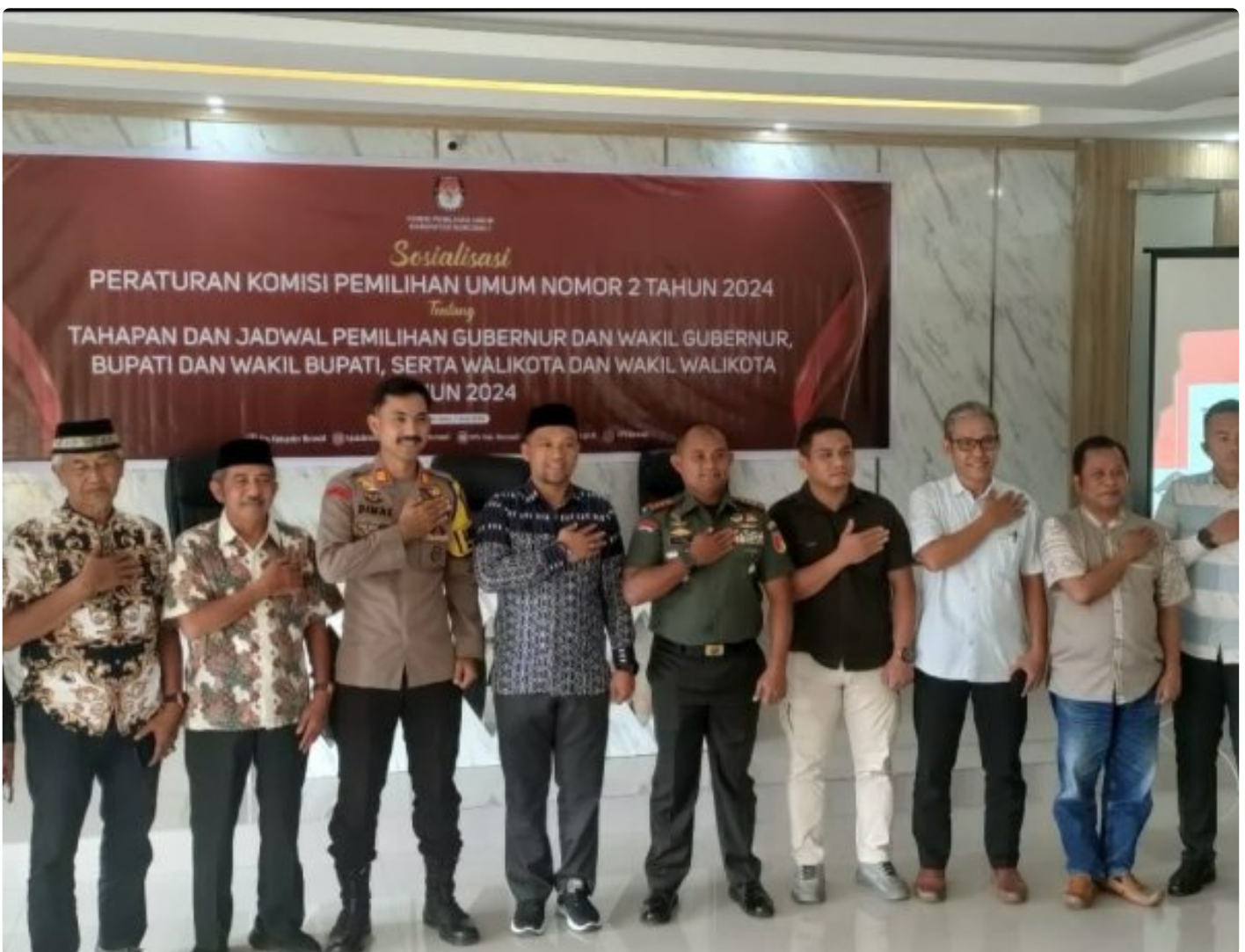
Pose bersama KPU Morowali