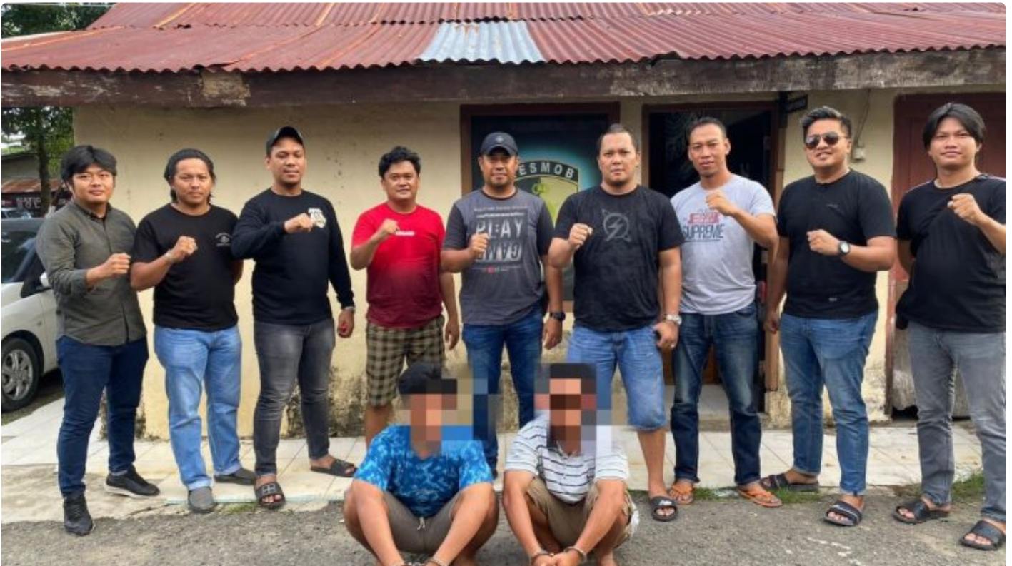
Tim Resmob Reskrim Polres Morowali saat menangkap pelaku pembunuhan

MOROWALI, Sulawesi Tengah- Pelaku penikaman perut terburai keluar hingga menyebabkan korbannya meninggal dunia inisial E (29) yang baru-baru ini terjadi di wilayah Kecamatan Bahodopi telah berhasil di tangkap Satreskrim Polres Morowali.