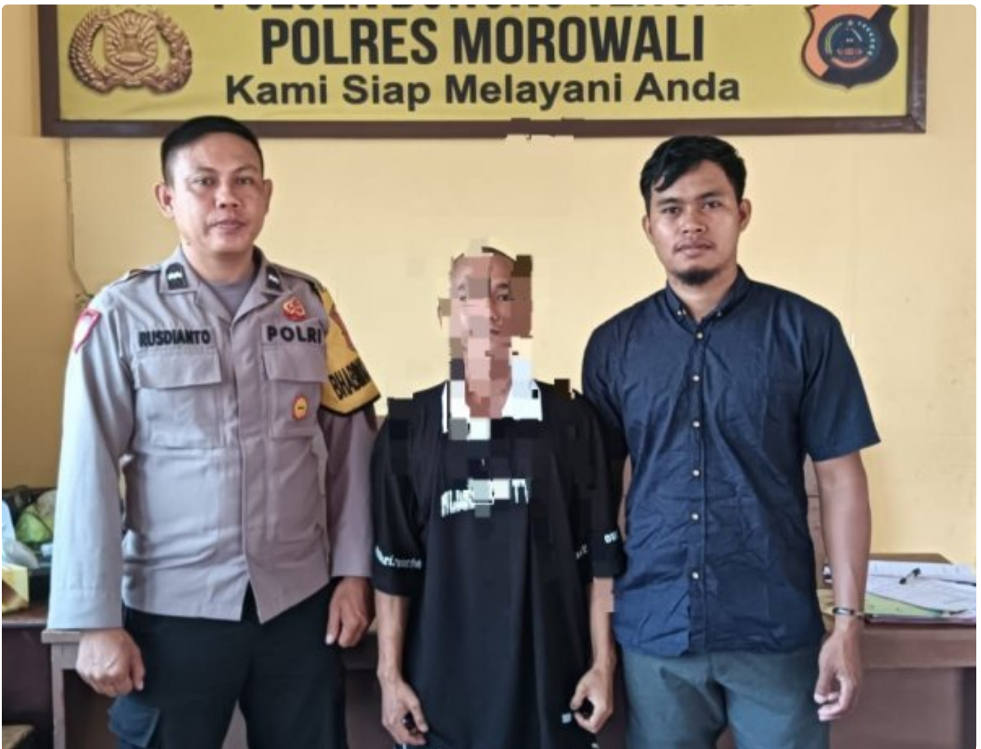
Aparat Polsek Bungku Tengah Berhasil Tangkap Pelaku Curanmor

MOROWALI, Sulawesi Tengah- Pada Hari Sabtu 5 Oktober 2024 Sekitar Pukul 18.30 Wita Kepolisian Sektor (Polsek) Bungku Tengah Polres Morowali, berhasil