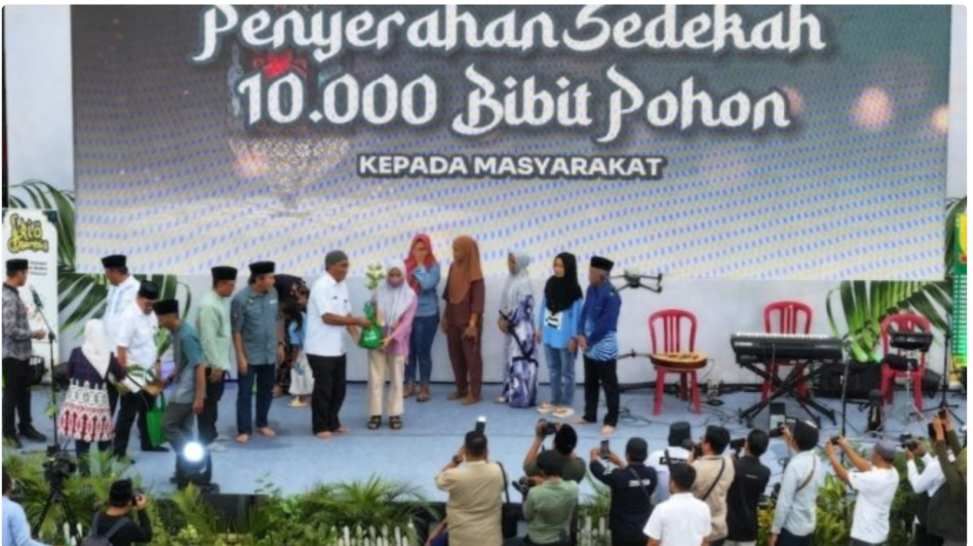
Penyerahan sedekah 10.000 bibit pohon

BONE, Indonesiasatu.co.id- DUKUNGAN PT Vale Indonesia untuk gerakan penghijauan yang digalakkan Pemerintah Provinsi Sulawesi Selatan terus berlanjut. Penjabat Gubernur Sulawesi Selatan, Bahtiar Baharuddin menyampaikan apresiasi dan menyerahkan penghargaan untuk perusahaan yang beroperasi di Sulawesi itu, dalam kegiatan Peringatan Nuzulul Quran Tingkat Provinsi di Lapangan Merdeka Kabupaten Bone, Rabu 27 Maret 2024.