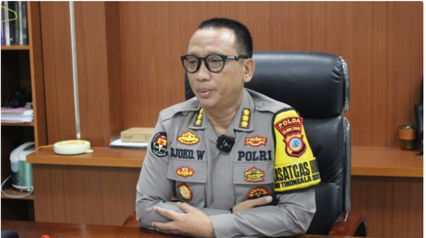
Kabidhumas Polda Sulteng Kombes Pol. Djoko Wienartono

PALU, Sulawesi Tengah- Kepolisian Negara Republik Indonesia (Polri) dalam tahun anggaran (T.A) 2024 kembali membuka pendaftaran penerimaan calon Taruna Taruni Akademi Kepolisian (Akpol) untuk putra-putri terbaik lulusan SMA/MA/Sederajat.