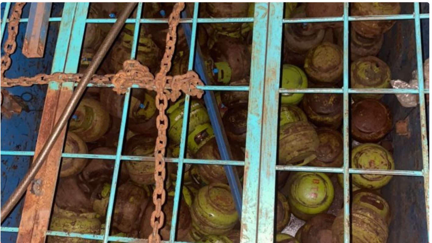
Tabung LPG 3 Kg bersubsidi yang amankan jajaran Polres Morowali

MOROWALI, Sulawesi Tengah- Jajaran Polres Morowali, Polda Sulteng baru-baru ini berhasil mengungkap kasus tindak pidana penyalahgunaan LPG 3Kg bersubsidi.