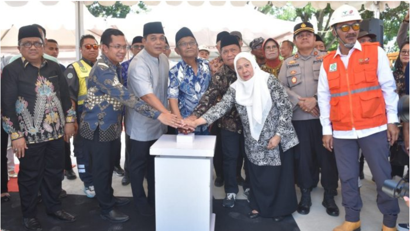
Gubernur dan Wagub Sulteng bersama Danrem 132/Tdl